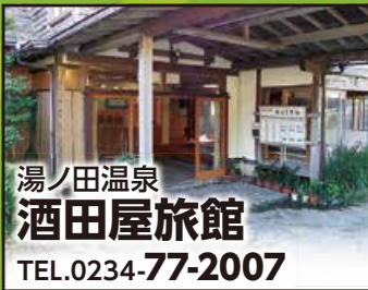
湯ノ田温泉 酒田屋旅館 TEL.0234-77-2007