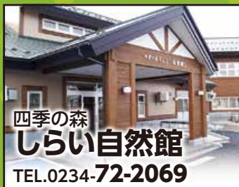
四季の森 しらいし自然館 TEL.0234-72-2069

10月23日(土)まで大平山荘も対象になります。 TEL.090-2607-2326