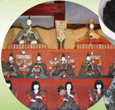
旧青山本邸の雛祭り