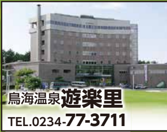
鳥海温泉 遊楽里 TEL.0234-77-3711